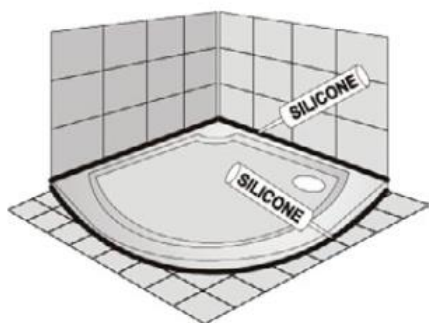
Usazená na podlaze