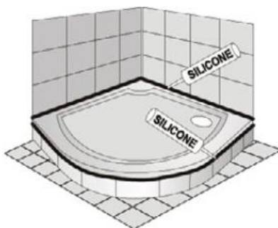
Obezděná a obložená